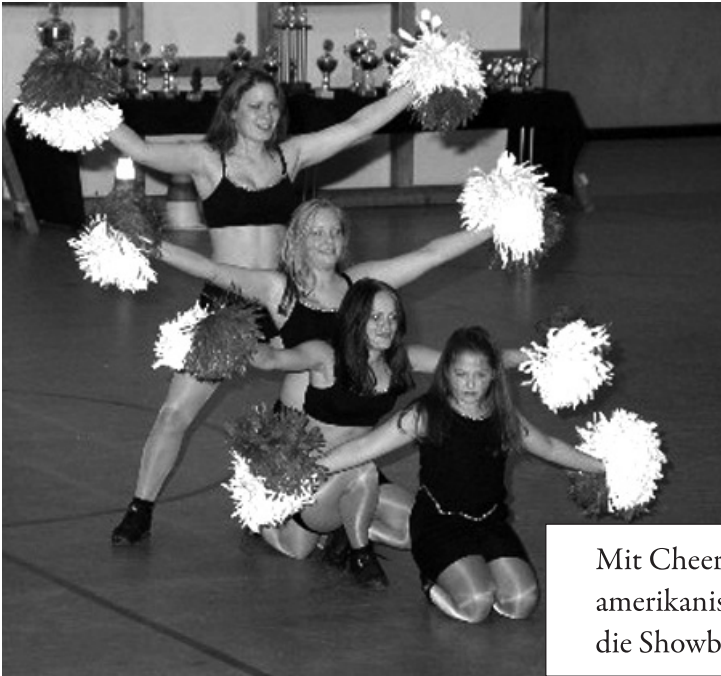
Mit Cheerleadern und im Stile einer amerikanischen Highschool-Marchingband: die Showband Green Lions